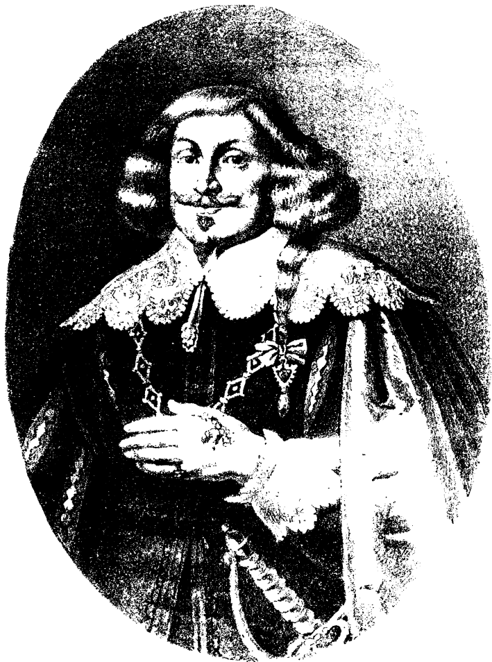
ВЛАДИСЛАВЪ IV. КОРОЛЬ ПОЛЬСКІЙ .