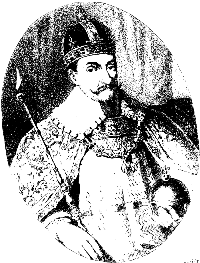
СИГИЗМУНДЪ III, КОРОЛЬ ПОЛЬСКІЙ.