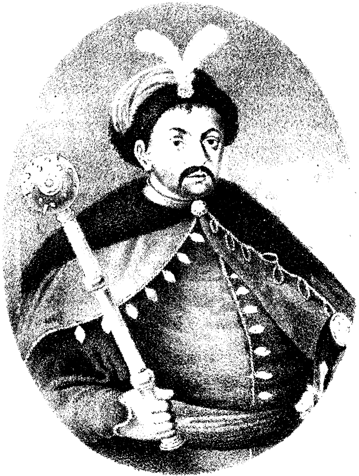
ГЕТМАНЪ БОГДАНЪ ХМЕЛЬНИЦКІЙ .